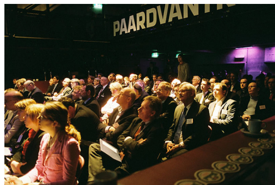
Figure 0. Stedenlink congres 'Connecting cities @ high speed'

vond in Amsterdam een symposium plaats waarin door de aanwezige netwerkbeheerders positief op de plannen werd gereageerd. In oktober vertrokken 25 deelnemers naar Milaan en Turijn voor de jaarlijkse studiereis. KL was verantwoordelijk voor een deel van het programma en de organisatie. In Turijn sloten de deelnemers zich aan bij het herfstcongres van 'Eurocities - Knowledge Society Forum' met als thema E-services for e-citizens. KL organiseerde verder drie bestuursvergaderingen en vijf kerngroepvergaderingen voor het netwerk. Daarnaast verzorgde KL de redactie voor de website www.stedenlink.nl . In 2006 telde de website 20.486 unieke bezoekers.