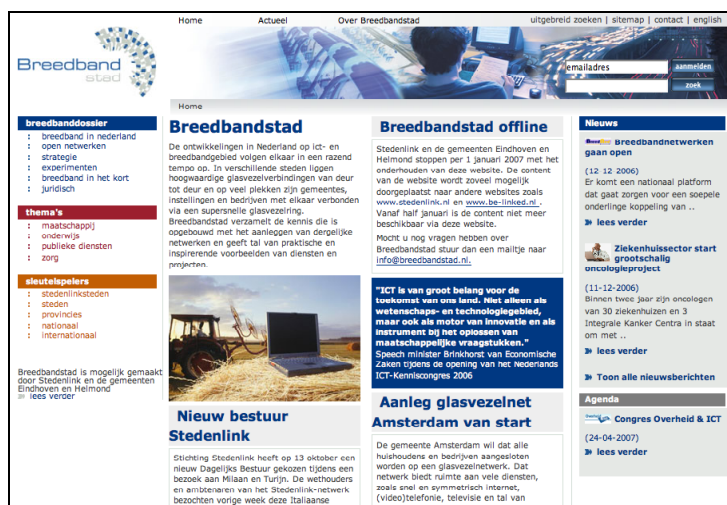
Figure 2. Kennisbank Breedbandstad