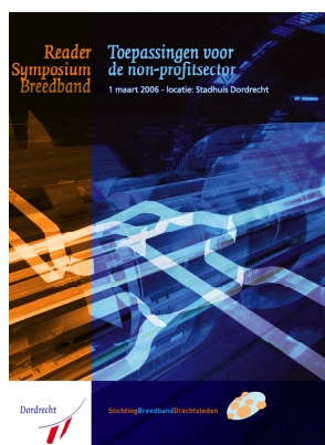
Figure 1. Toepassingen voor de non-profitsector