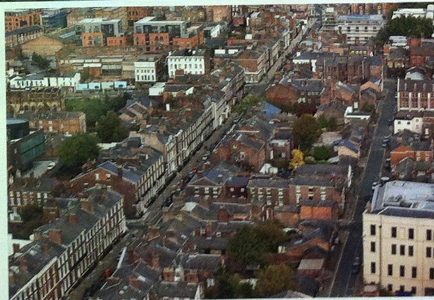
Liverpool, waar het initiatief van The Street Doctors begon