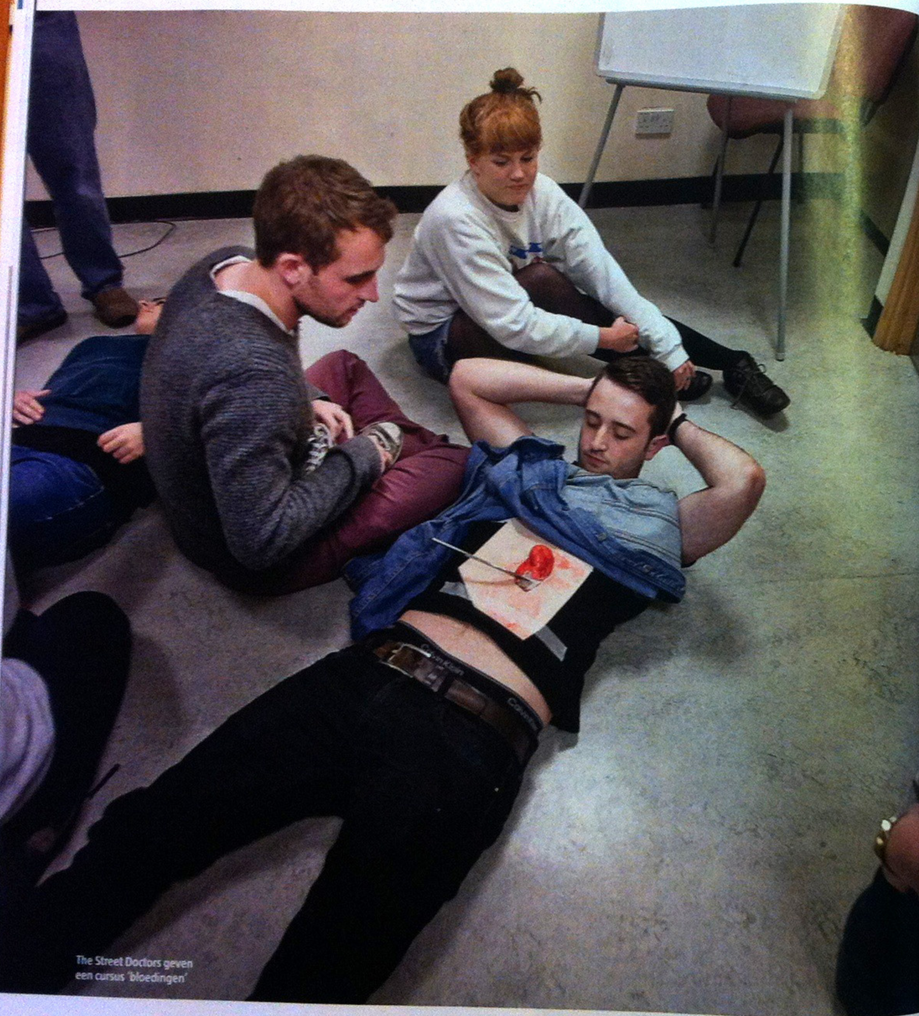
The Street Doctors geven een cursus 'bloedingen'